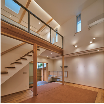
ギャラリーを持つ家

絵画を飾るためのギャラリー。玄関入口には北山杉の磨き丸太の柱、土間床には石州瓦をタイルに焼き上げ敷き詰めました。