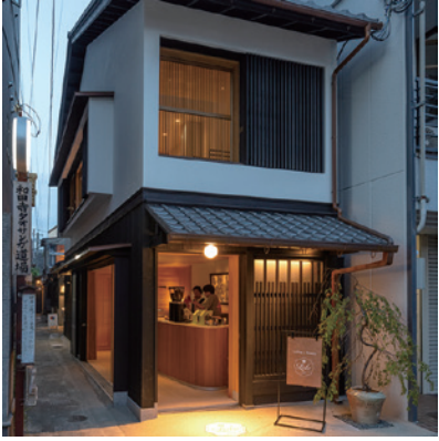
Cafe Loto Kyoto

お店や事務所にも無垢材を使って木の香りのする建物に仕上げ、新しいお店と建物の魅力を引き出します。